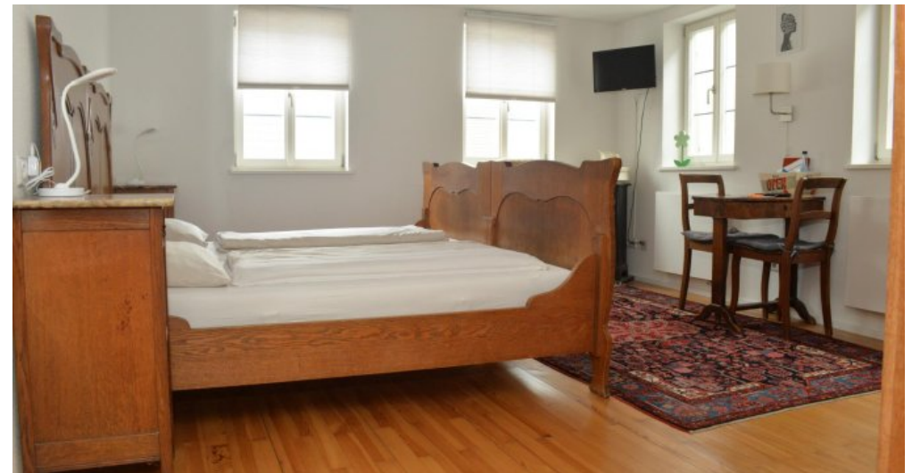
DZ Pension OG