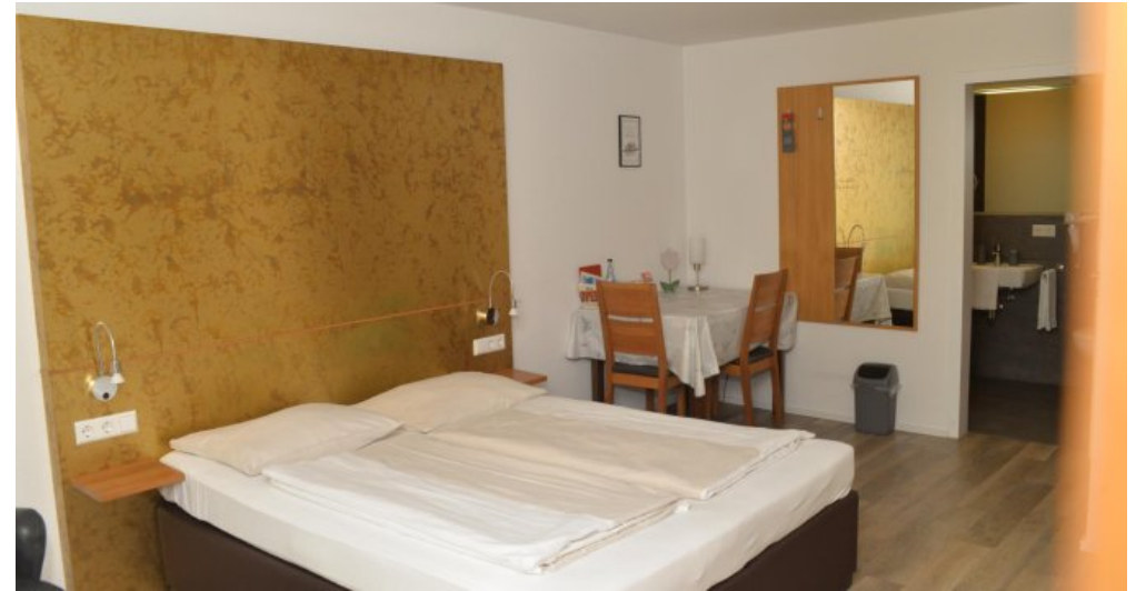
Doppelzimmer Pension EG