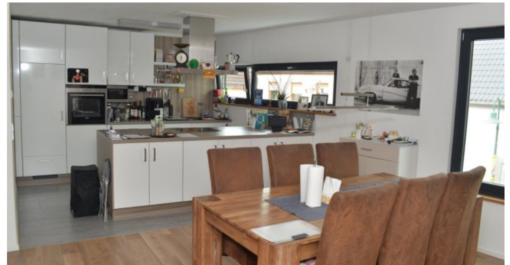
Ess-Küchenbereich WH OG