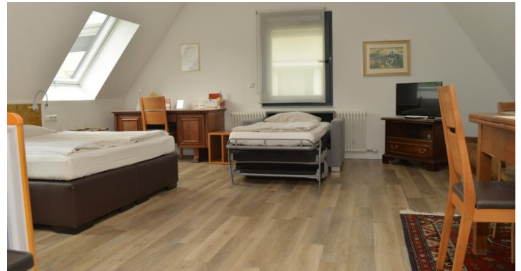
DZ Pension DG