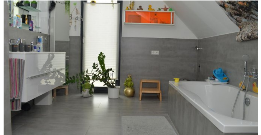
Bad WH DG