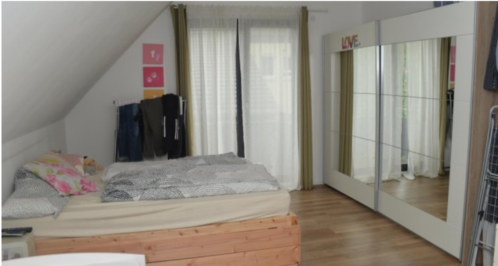
Schlafen WH DG