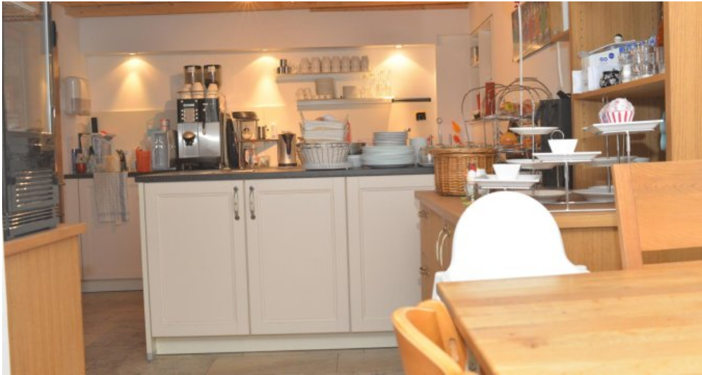
Buffetraum Pension EG