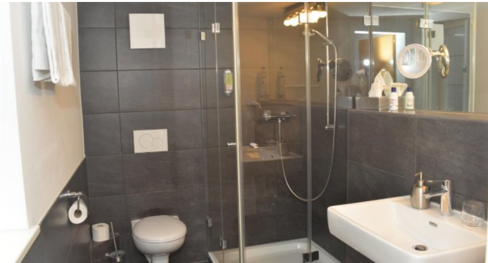
Bad DZ Pension OG