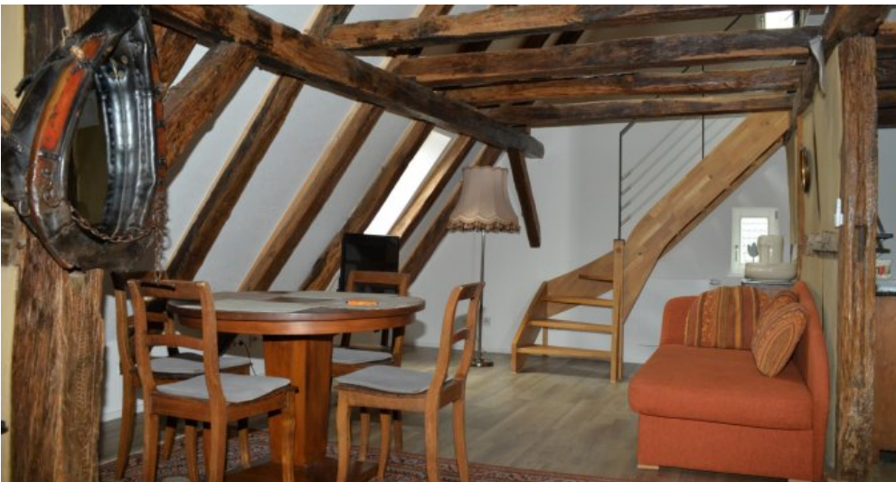
Galerie.z. Pension DG