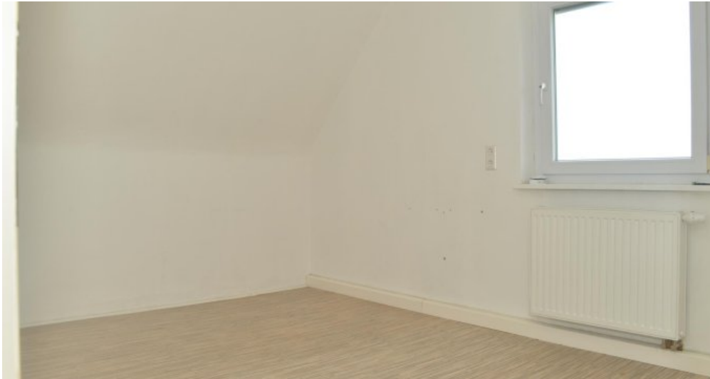
Zimmer II DG