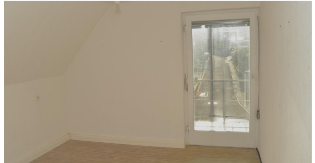
Zimmer I DG