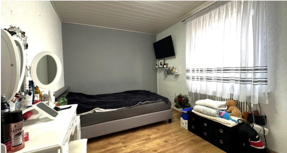
Kind II (OG)