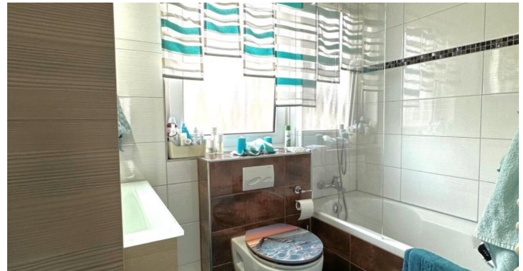
Bad I (OG)