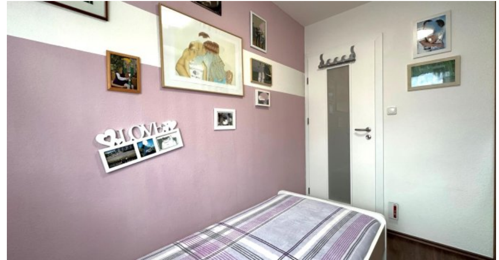
Kind I (OG)