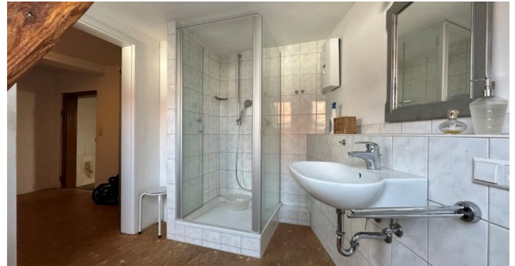
Bad DG II