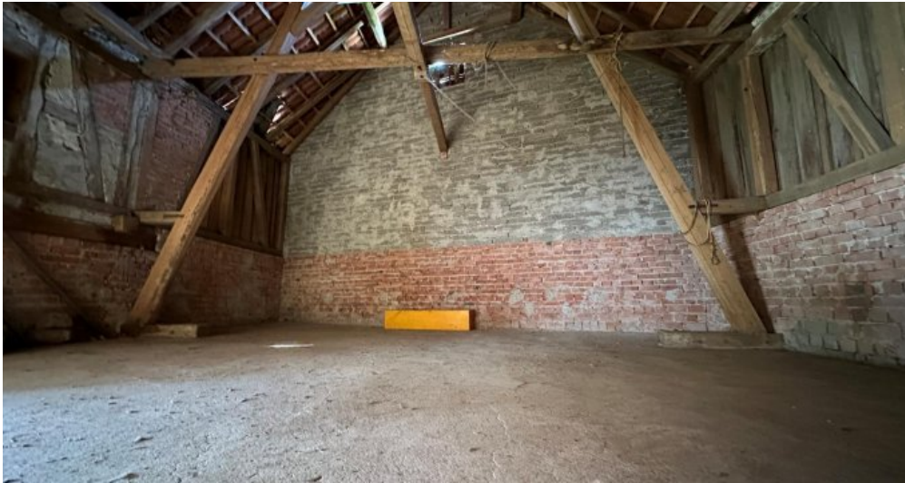
Lager ü. Stall