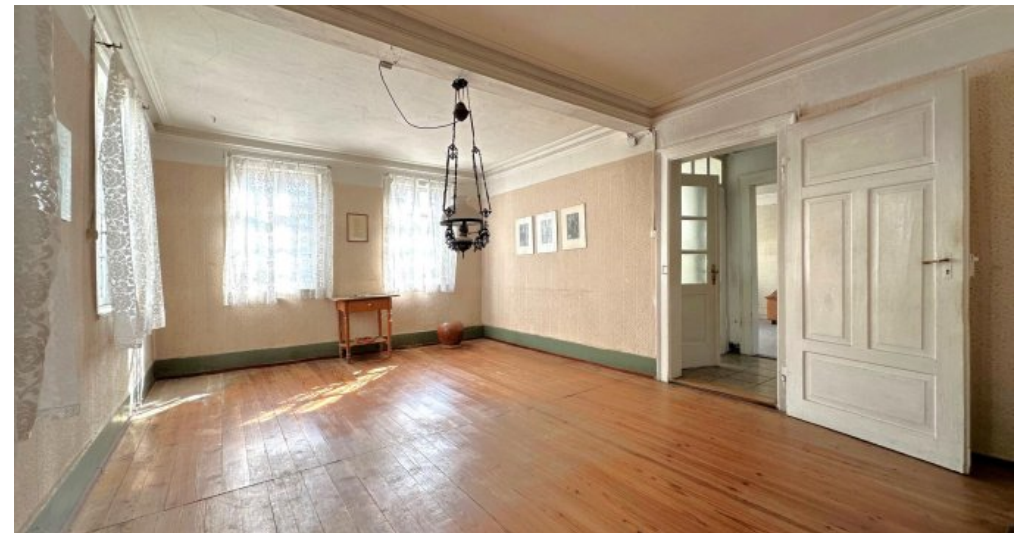
Wohnen oder Essen