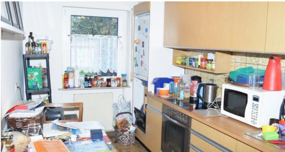
Küche ELW UG