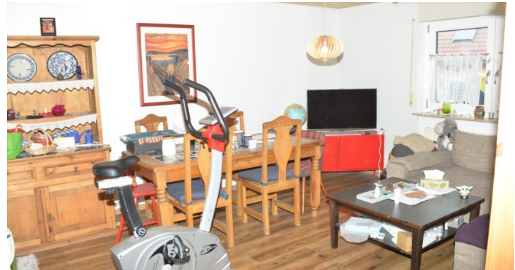
Zimmer ELW (UG)