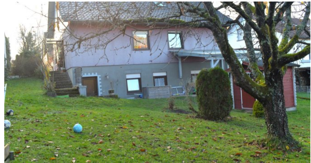
Hausansicht vom Garten