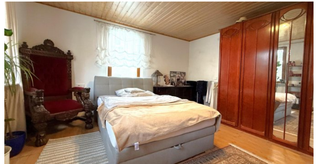
Schlafen II (OG I)