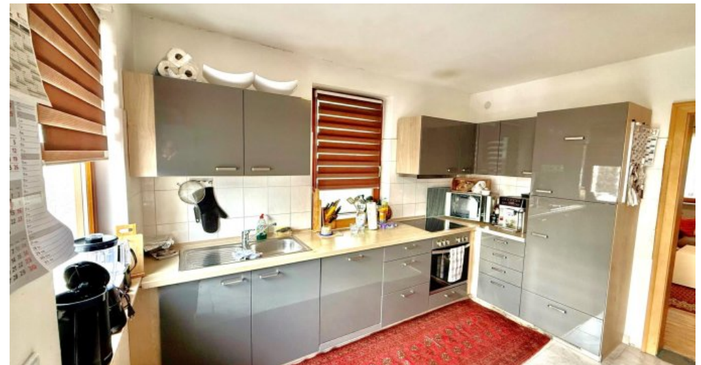
Küche (OG I)