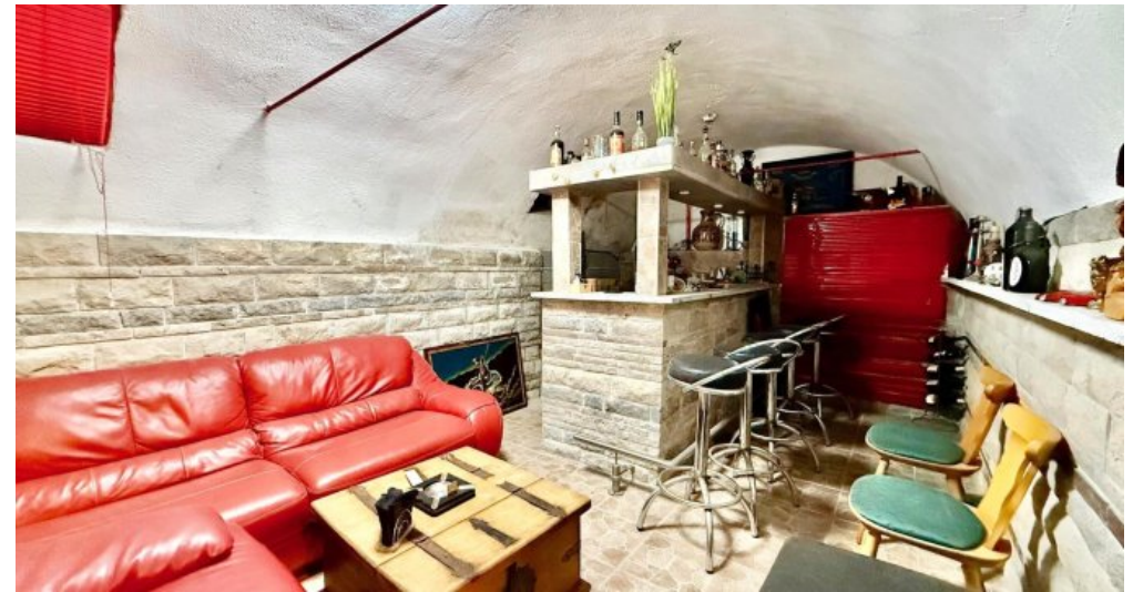
Bar-Partyraum im Gewölbe