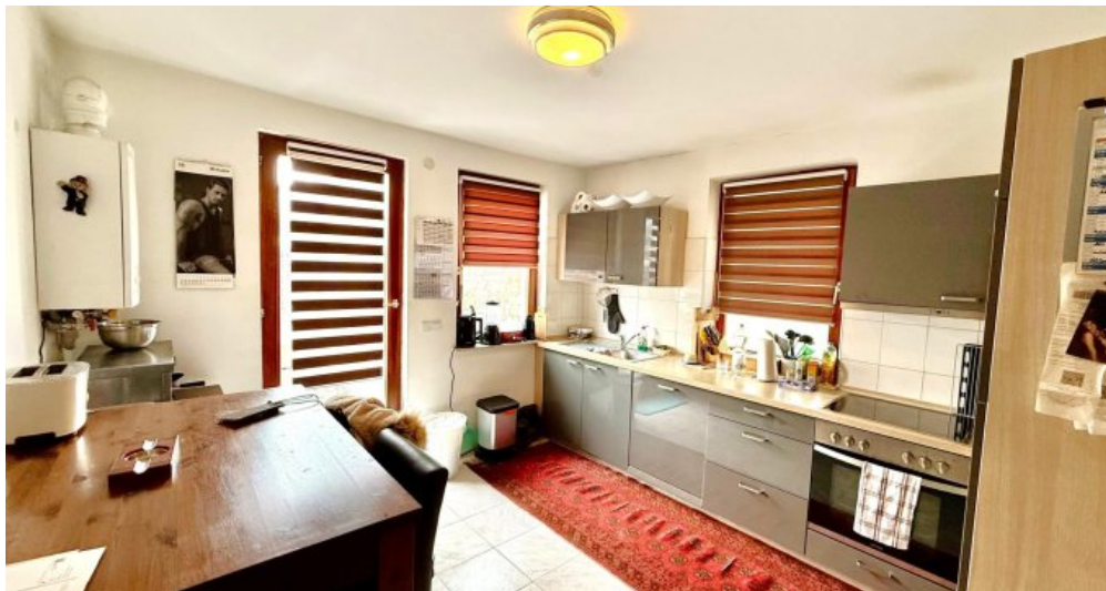
Küche (OG I) -