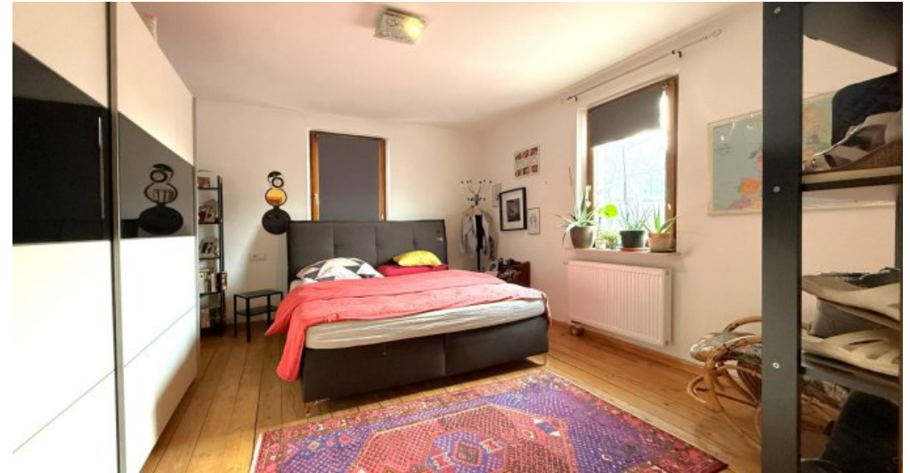
Schlafen (OG I)